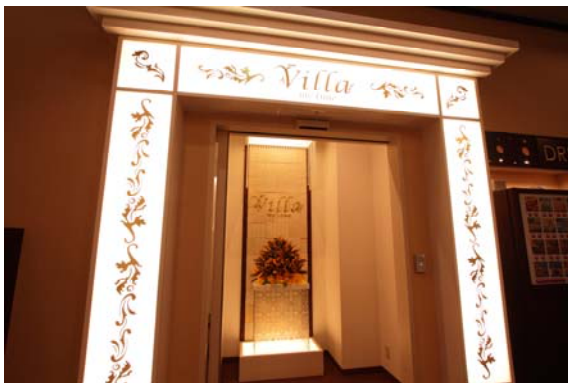
セキュリティーゲート