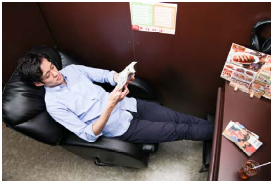
リクライニングシート