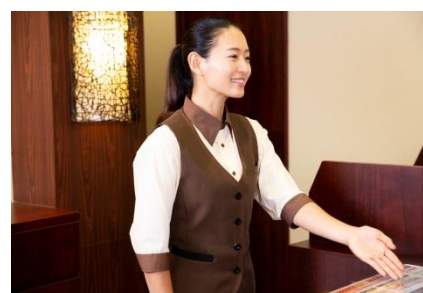
快活CLUBスタッフが24時間対応 (ジムスタッフ対応時間は11:00～20:00)