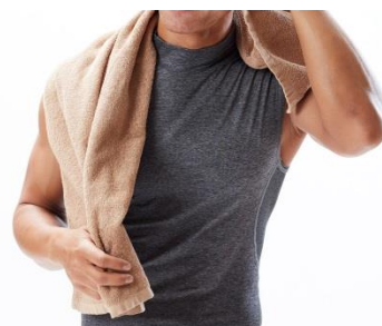
バスタオル・フェイスタオルのご利用が無料