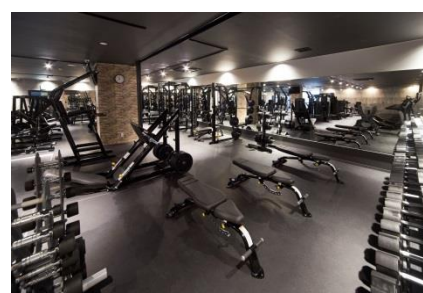
ウェイトトレーニングマシン