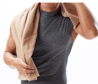
バスタオル・フェイスタオルのご利用が無料