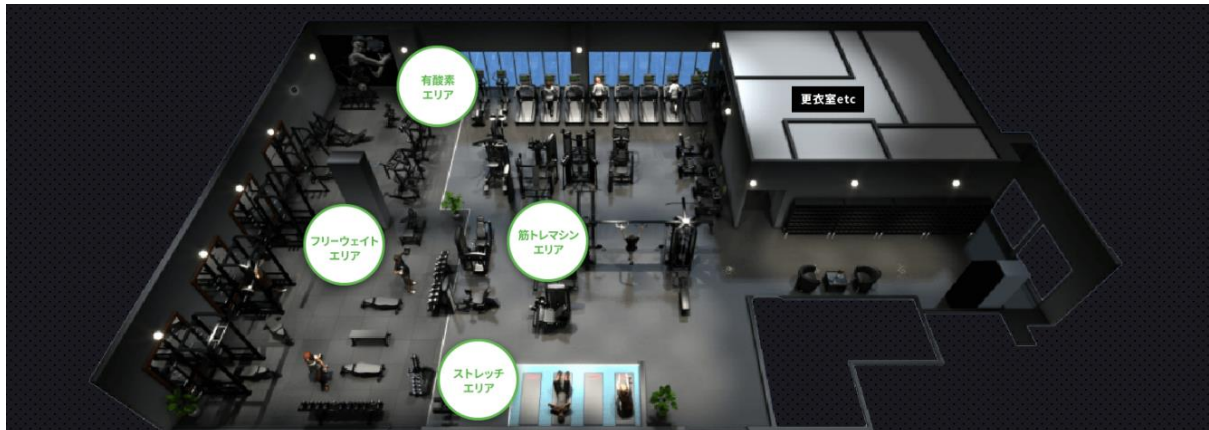
パース・設置マシンはイメージです。実際とは異なります。