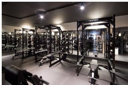
フリーウエイト機器