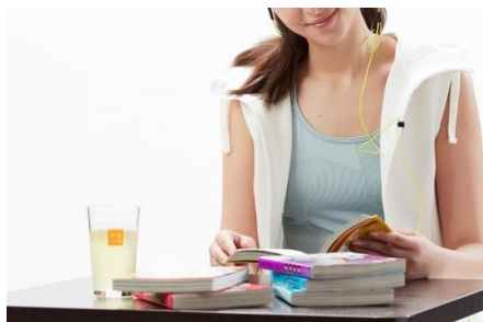
快活CLUBのコミック・雑誌・ドリンクバーのご利用が1日1回1時間無料

「快活CLUB」併設なので、施設の相互利用をはじめ、充実したアメニティやサービスをご用意しております。