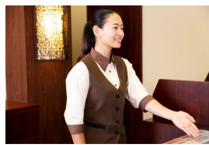
快活CLUBスタッフが24時間対応(ジムスタッフ対応時間は11:00～20:00)