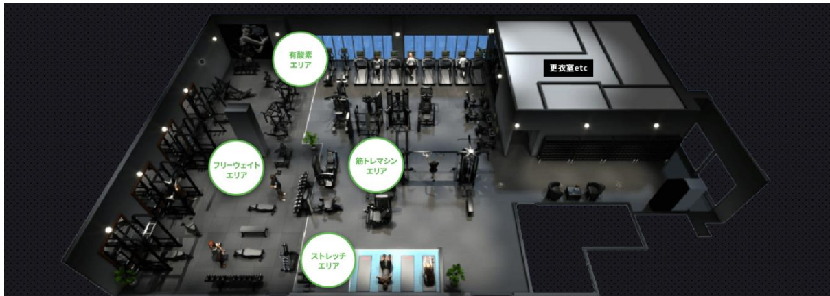
パース・設置マシンはイメージです。実際とは異なります。